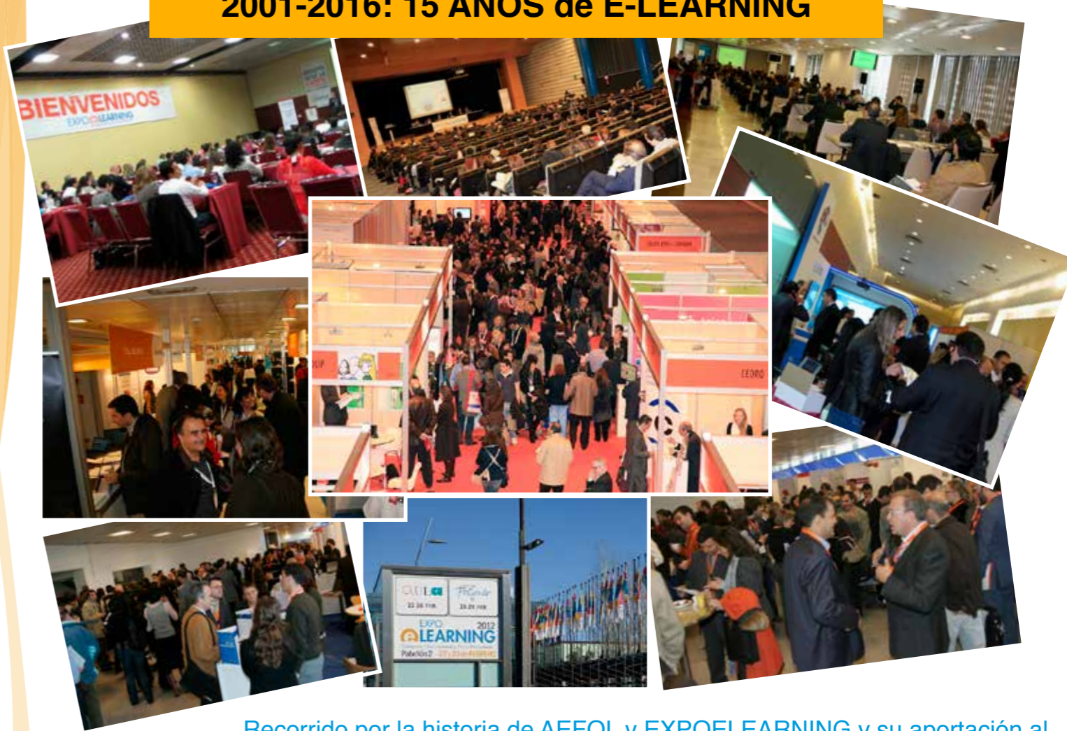
Recorrido por la historia de AEFOL y EXPOEARNING y su aportación al desarrollo del sector en España y América Latina.